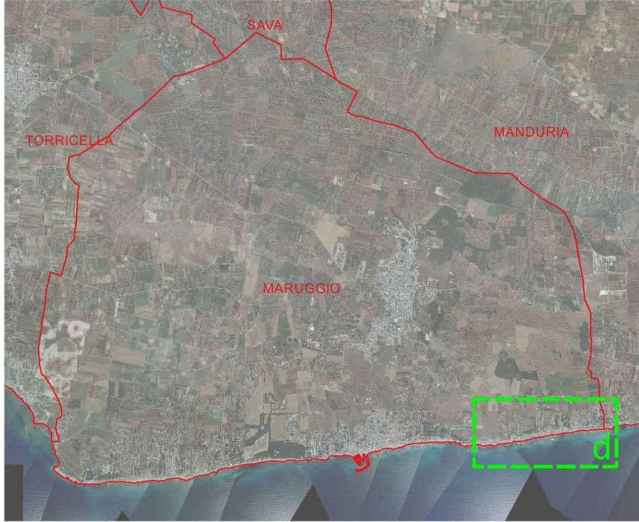
Base tavola: CTR 2006 1:5.000

Linea di costa anno 2018 (Shapefile: Linea_costa_2018) Linea di costa anno 2018 Dividente demaniale - Aprile 2016 (Shapefile: puglia_Dividentedemaniale_apr16_Puglia) Dividente demaniale - Aprile 2016