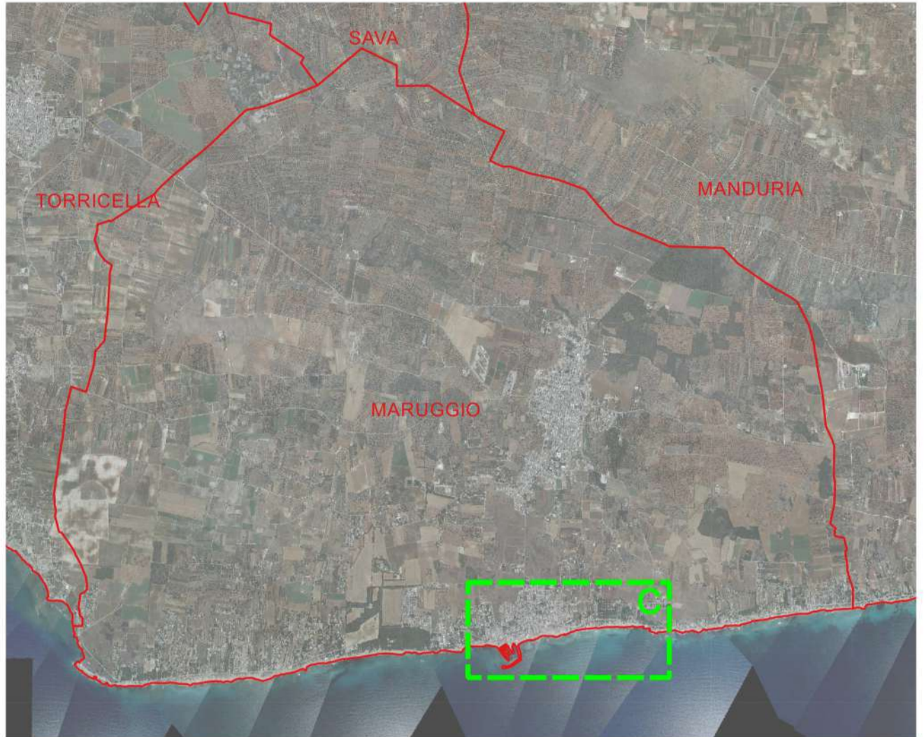
Base tavola: CTR 2006 1:5.000