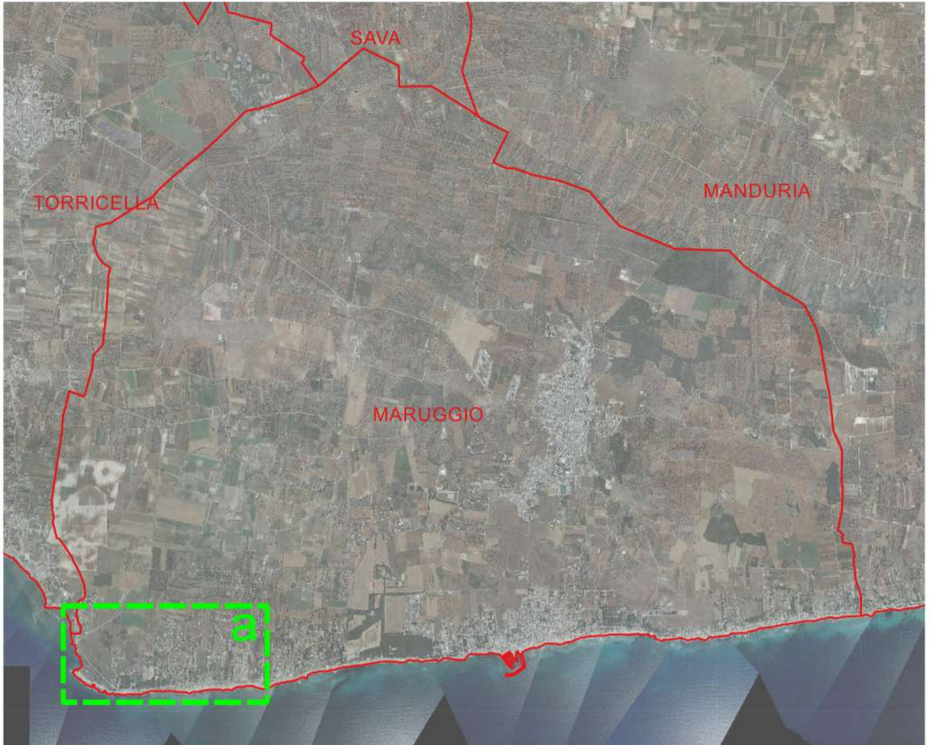
Base tavola: CTR 2006 1:5.000