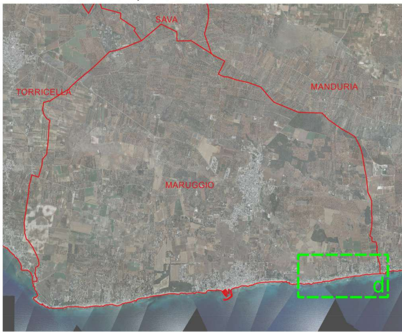
Base tavola: CTR 2006