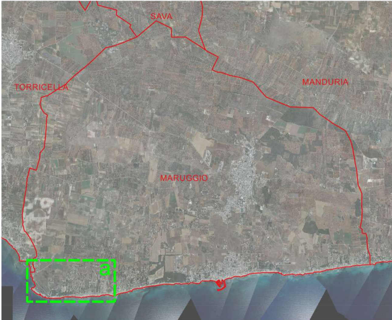
Base tavola: CTR 2006