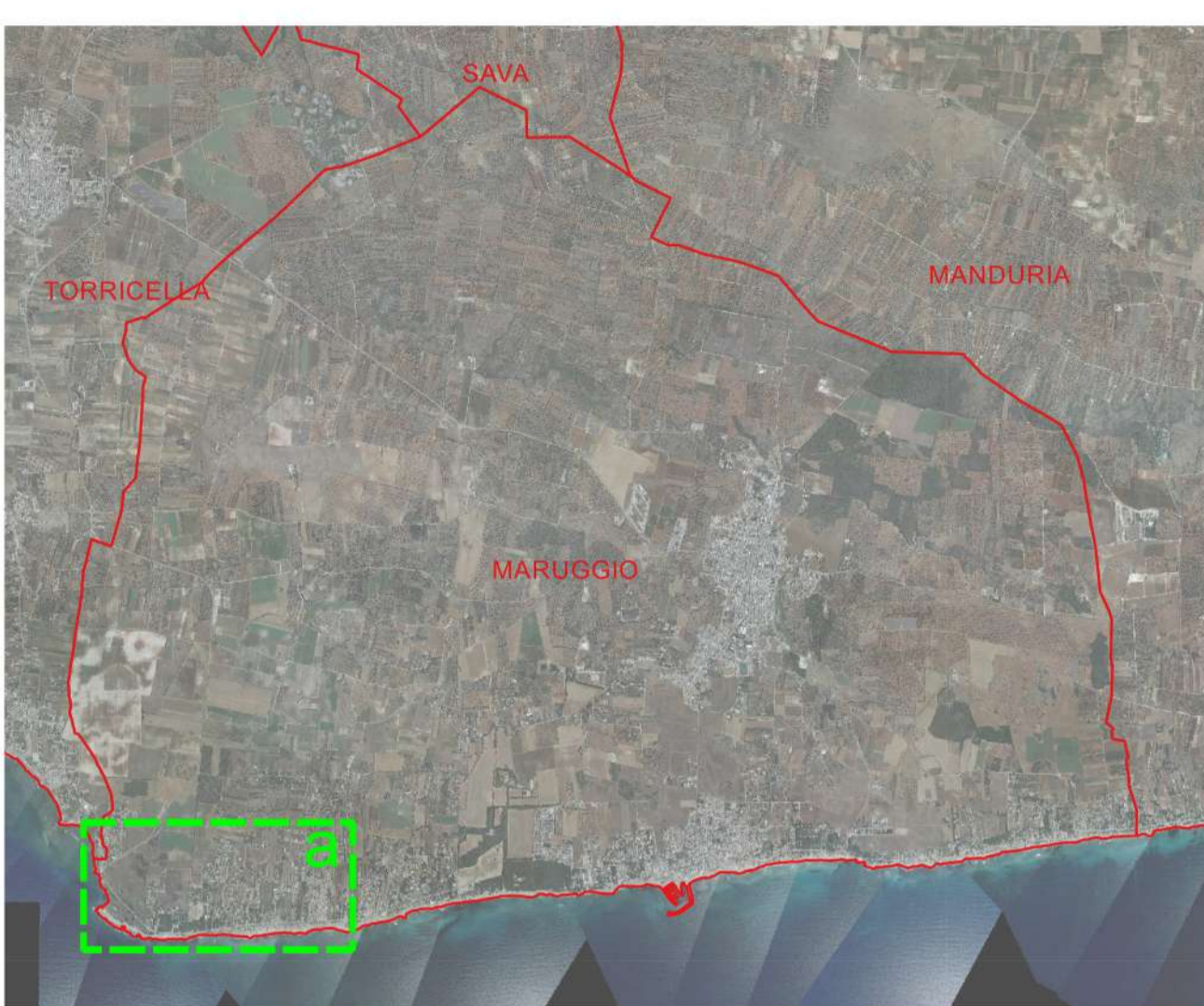
Base tavola: CTR 2006 1:5.000