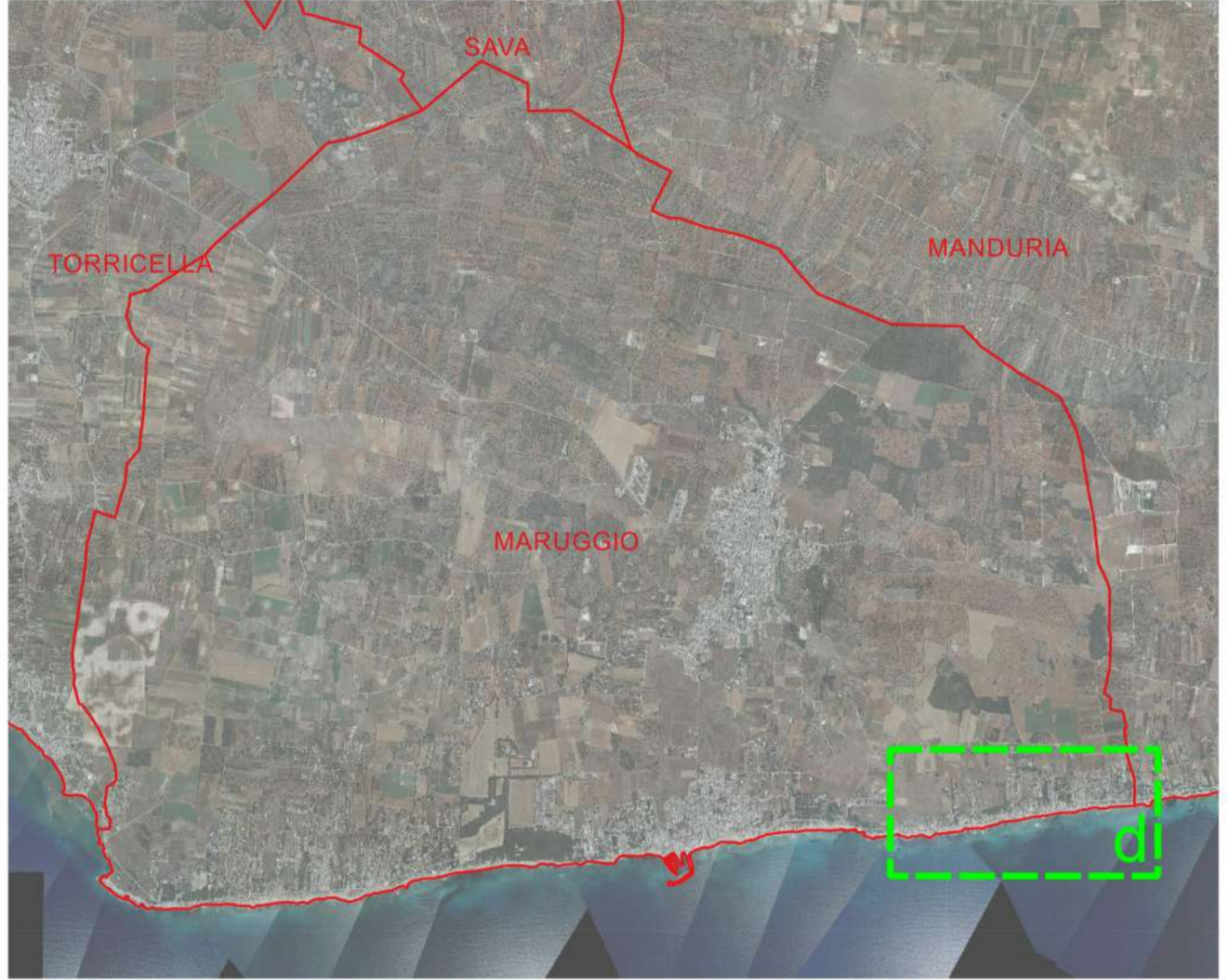
Base tavola: CTR 2006 1:5.000