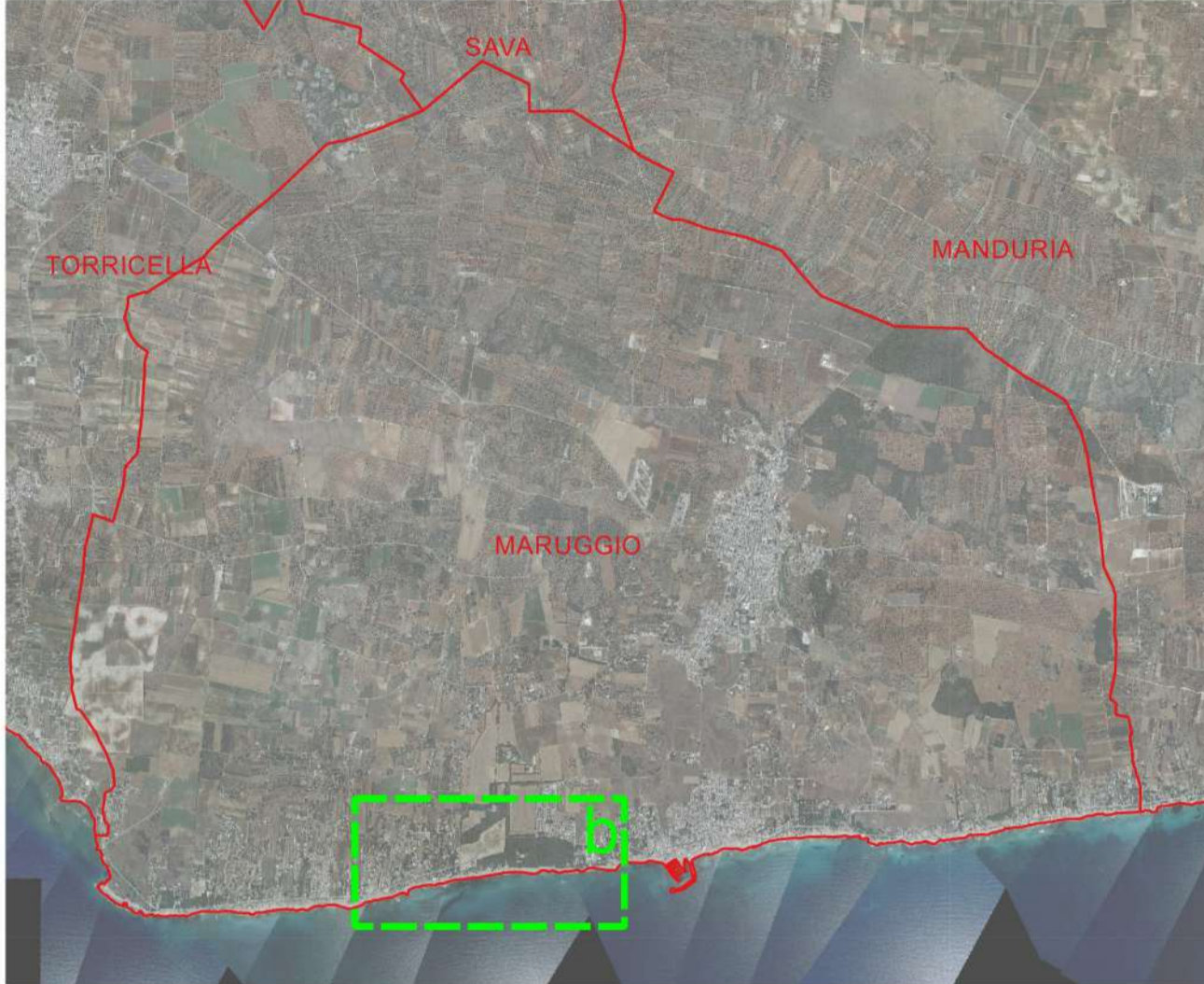
Base tavola: CTR 2006 1:5.000